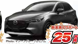
Photo: マークグレープレミアム メタリックは44,000円高 MAZDA2 XD SPORT+ 2WD 6EC-AT メーカー希望小売価格 2,402,000円(消費税込)