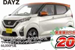
Photo: ホワイトパールプレミアム サンシャインオレンジ2トーンは 66,000円高 デイズ ハイウェイスターGターボ 2WD メーカー希望小売価格 1,674,200円(消費税込)