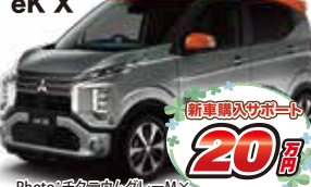
Photo: 子タニウムグレーM× サンシャインオレンジMIは60,500円高 eK X スペース 2WD CVT ターボ メーカー希望小売価格 1,895,520円(消費税込)