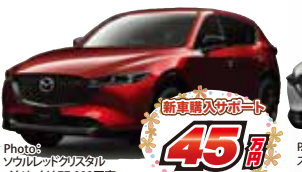
Photo: ソリッドクリスタル メタリックは77,000円高 CX-5 XD Sports Appearance 2WD 6EC-AT メーカー希望小売価格 3,900,600円(消費税込)