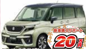
Photo: 半クラッシュホワイト パールM ガンM2トーンルーフは44,000円高 ソリオバンディット HYBRID MV 2WD CVT メーカー希望小売価格 2,125,200円(消費税込)