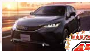
Photo: ハリアー Z "Leather Package" HYBRID 2WD メーカー希望小売価格 4,928,000円(消費税込)