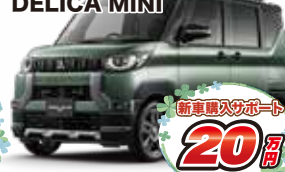
Photo: アッシュグリーンM×ブラックマイカは82,500円高 デリカミニ Tプレミアム 2WD メーカー希望小売価格 2,074,600円(消費税込)