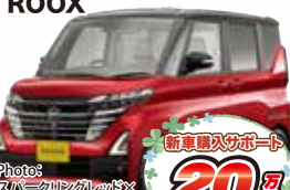
Photo: スパイクリングレッド× ブラック 2トーンは55,000円高 ルークスハイウェイスターGターボ 2WD メーカー希望小売価格 2,057,000円(消費税込)