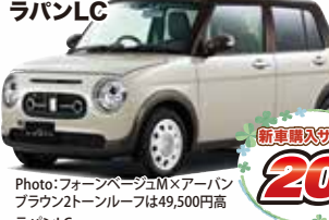
Photo: フォーンベージュM×アーバン ブラウン2トーンルーフは49,500円高 ランPLC 2WD CVT メーカー希望小売価格 1,622,500円(消費税込)