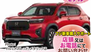
Photo: イルミネーションのメタリックは 38,500円高 WR-V Z+ FF メーカー希望小売価格 2,489,300円(消費税込)