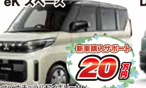
Photo: ナチュラルアイボリーM× ブラックは82,500円高 eK スペース G 2WD CVT メーカー希望小売価格 1,661,000円(消費税込)