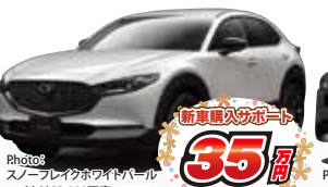
Photo: スノープレイクレストパール マイカは33,000円高 CX-30 XD Retro Sports Edition 2WD 6EC-AT メーカー希望小売価格 3,441,900円(消費税込)